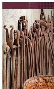
Pincos de manutention. Forge Clément, Corravillers (Franche-Comté)

La base Architecture - Mérimée - recense des édifices dans lesquels peuvent être conservées des oeuvres mobilières étudiées dans la base Palissy